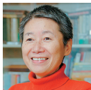
【小説部門】 中山 千夏 (作家)